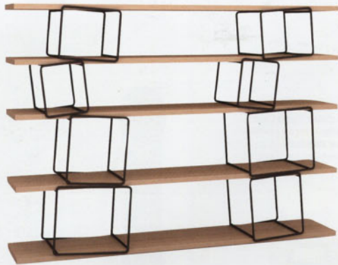
"Quake", design Antoine Phelouzat . Une bibliothèque modulable composée d'étagères en épicéa, hêtre ou chêne massif et de modules en fil d'acier. Eno