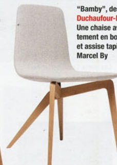
"Bamby", design Noé Duchaufour-Lawrance . Une chaise avec piétement en bois massif et assise tapissée. Marcel By