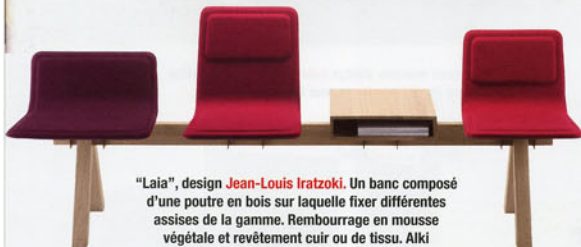
"Laia", design Jean-Louis Iratzoki . Un banc composé d'une poutre en bois sur laquelle fixer différentes assises de la gamme. Rembourrage en mousse végétale et revêtement cuir ou de tissu. Alki