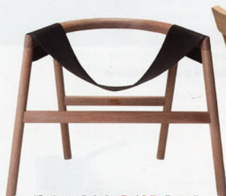
"Dartagnan", design Toni Grilo . Fauteuil avec structure en chêne naturel ou teinté noir et assise en cuir noir. Haymann