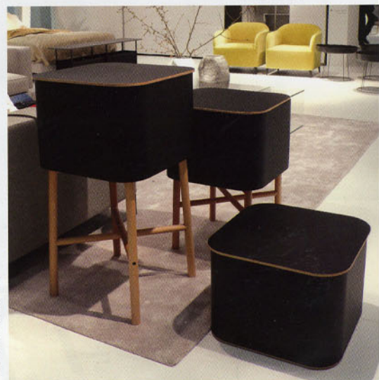
"Ô Perché", design Julie Pfligersdorffer . Boîtes de rangement en multiplis laqué noir sur un piétement en hêtre massif. Premier Prix du Concours Design Cinna 2011 dans la catégorie "Petits Meubles". Cinna