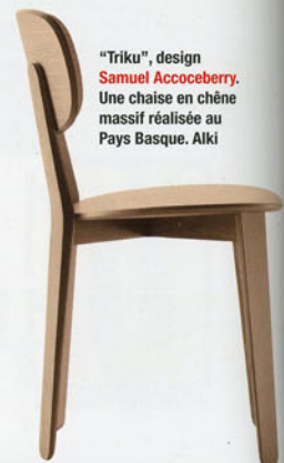
"Triku", design Samuel Accoceberry . Une chaise en chêne massif réalisée au Pays Basque. Alki