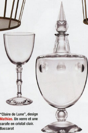
"Claire de Lune", design Mathias . Un verre et une carafe en cristal clair. Baccarat