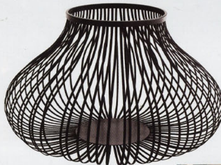
"Bidum", design Laetitia Florin . Un panier de rangement en lames d'acier ressort gainées d'un ruban de coton. Cinna