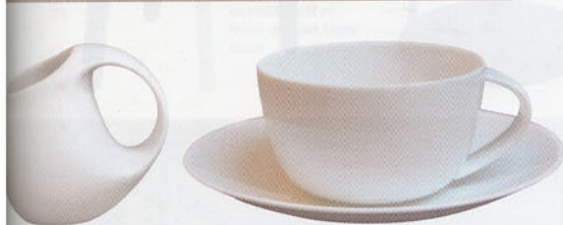
La saucière et la tasse à thé de la Collection "Bulle". Bernardaud