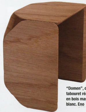
"Domen", design Sébastien Cordoléani . Un tabouret réalisé par l'assemblage de planches en bois massif, finition chêne naturel ou laqué blanc. Eno