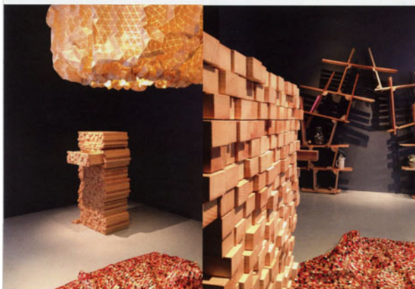
L'exposition "Knock on Wood" à la Tools Galerie. Une bibliothèque de Peter Marigold , la commode "Wooden" de Boris Denmler , tapis et suspension d' Elisa Strozyk .