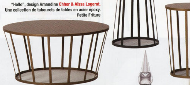
"Hollo", design Amandine Chhor & Aïssa Logerot . Une collection de tabourets de tables en acier époxy. Petite Friture