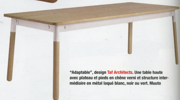
"Adaptable", design Taf Architects . Une table haute avec plateau et pieds en chêne verni et structure intermédiaire en métal laqué blanc, noir ou vert. Muuto