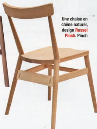
Une chaise en chêne naturel, design Russel Pinch . Pinch