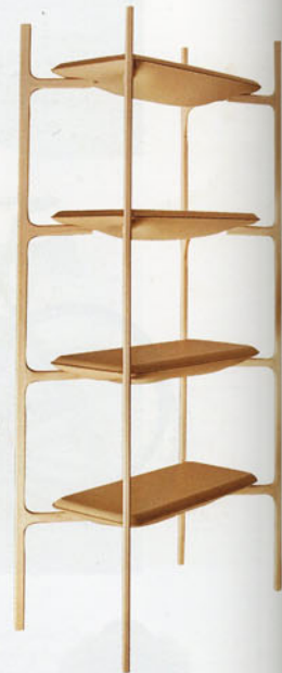
"Bloated Shelf", design Damien Gernay . Une étagère en frêne et cuir avec rembourrage en mousse. Dust Deluxe