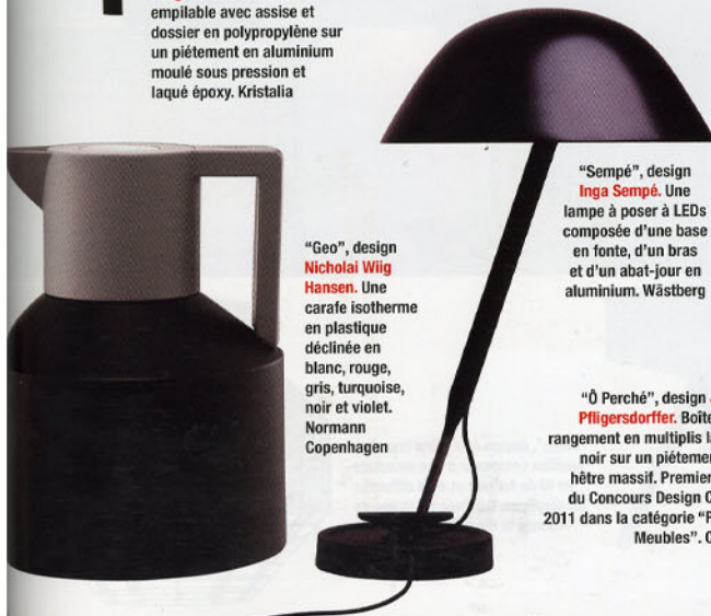
"Sempé", design Inga Sempé . Une lampe à poser à LEDs composée d'une base en fonte, d'un bras et d'un abat-jour en aluminium. Wästberg