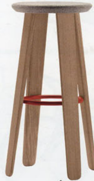
"Triku", design Samuel Accoceberry . Un tabouret en chêne massif avec anneau métallique coloré. Alki