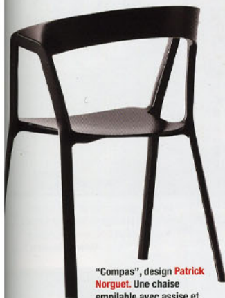
"Compas", design Patrick Norguet . Une chaise empilable avec assise et dossier en polypropylène sur un piétement en aluminium moulé sous pression et laqué époxy. Kristalia